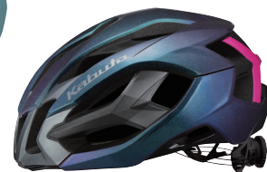
ロードバイク用ヘルメット (IZANAGI)