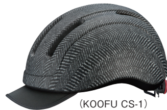
(KOOFU CS-1) 街乗り用ヘルメット