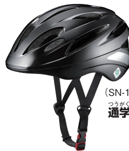
(SN-13) 通学用ヘルメット