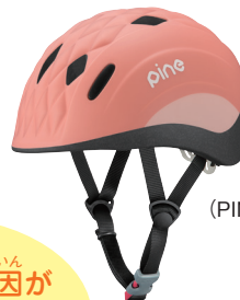
こども用ヘルメット (PINE)