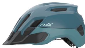
MTB・スポーツ用ヘルメット (FM-X)